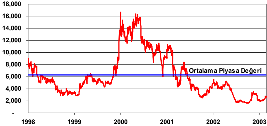
İş Bankası C Piyasa Değeri (milyon US$)

2001 yılından bu yana ortalama $4.2 milyar piyasa değeri ile işlem gören İş Bankası 2002 yılı Mayıs ayından itibaren $4 milyar seviyesinin altına gerilemişti. Haziran ayı ortasında da $3 milyarın altına gerileyen İş Bankası sene sonuna kadar çoğunlukla $1.6-2 milyar aralığında seyretti. 2003 yılında da bu seyrini devam ettiren İş Bankası'nın endeksteki ağırlığı 8-9%'a geriledi (Ocak 2003 itibariyle). Geçtiğimiz günlerde açıklanan $100 milyon'un üzerindeki iştirak satışı, düşen faizler ile artan sermaye piyasası karları ve azalan kambiyo zararları ile 310 trilyon TL kar ile İş Bankası'nın piyasa değeri endekse de bağlı olarak $2.27 milyar'dan $2.7 milyara yükseldi. 2002 yılı ortalamaları göz önüne alındığında İş Bankası'nın ortalama $3 milyar piyasa değerine ilk etapta endekse de paralel olarak ulaşması beklenebilir. Mevcut kurlar itibariyle bu piyasa değeri 6,000 seviyelerine denk gelmektedir. İş Bankası'nın mevcut yeniden yapılanma süreci, İstanbul Yaklaşımı doğrultusunda kredi portföyündeki olumlu gelişmeler ve sağlam mevduat tabanına dayanarak İş Bankası için pozitif yatırım düşüncemizi koruyoruz. En düşük piyasa değeri olan $1.6 milyar seviyelerini 2002 yılı Temmuz ve Ekim aylarında test eden İş Bankası'nın çoğunlukla işlem gördüğü $2 milyarın da oldukça düşük olduğunu düşünüyoruz. Bu doğrultuda karının açıklanmasını takip eden günlerde hızlı bir çıkış yapan İş Bankası için $2.9-3 milyar seviyelerine kadar "AL" tavsiyemizi yineliyoruz.